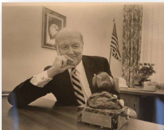
El Exmo. Alcalde de Coral Gables posa con una escultura del artista.