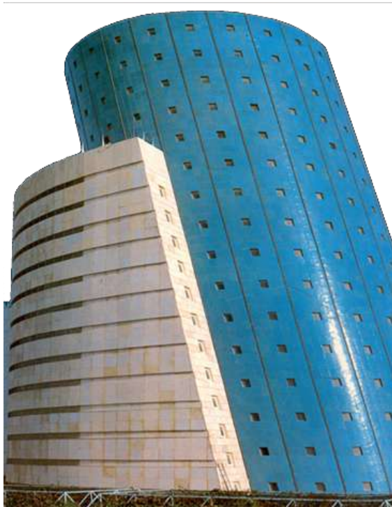
Torre inclinada del Pabellón de Andalucía para la exposición universal de Sevilla España 1992 .

Como una faceta más de su trabajo, en el campo de la ARQUITECTURA , en Octubre de 1995 inaugura la primera fase de su ambicioso proyecto “PABELLÓN DE LAS ARTES”, un conjunto de ARQUITECTURAS ESCULTÓRICAS vanguardistas que dan un carácter singular y personal a su actividad arquitectónica y nos recuerdan el concepto renacentista de la fusión entre escultura y arquitectura, según Miguel Ángel, Leonardo y otros.