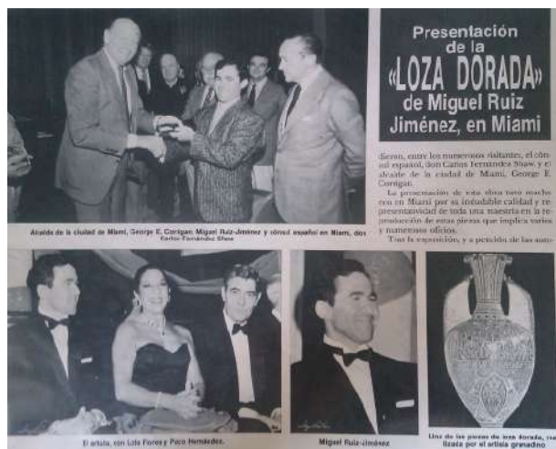
Imágenes del artista en Coral Gables, Miami, con motivo de la inauguración del hotel Hyatt en 1988.