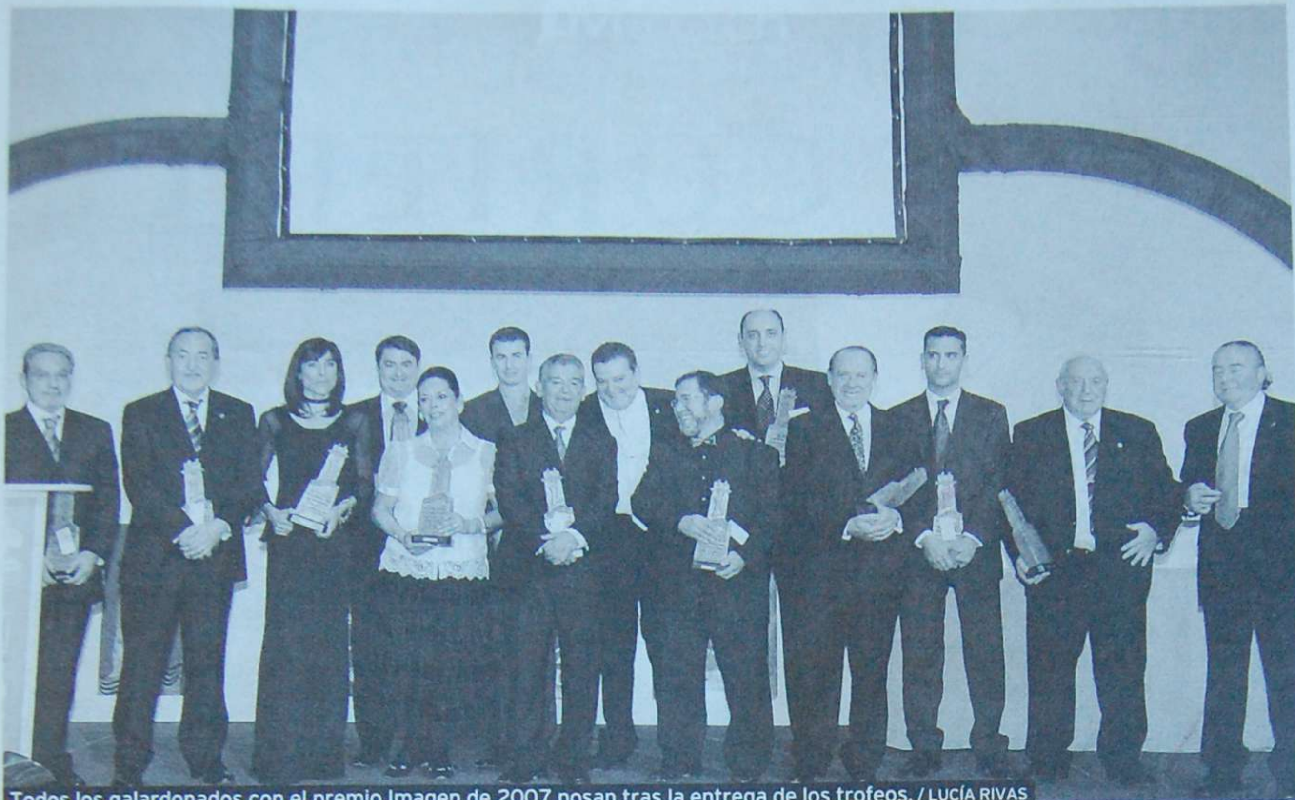
Todos los galardonados con el premio Imagen de 2007 posan tras la entrega de los trofeos.